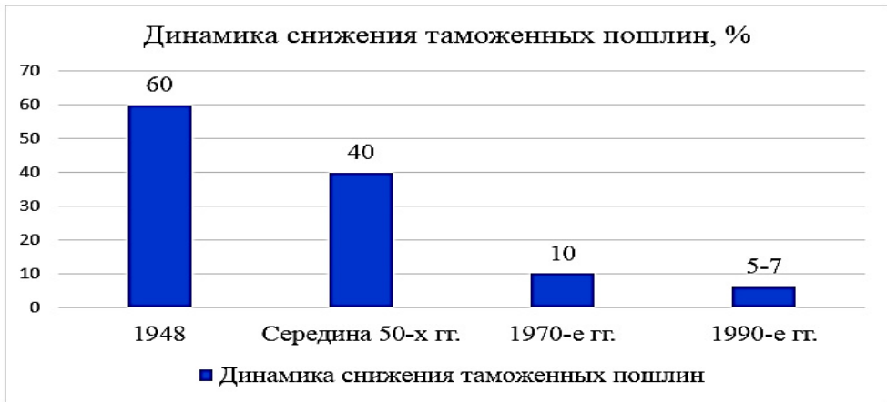
Рис. 1. Динамика снижения средней величины таможенных пошлин (составлено автором)

По данным, указанным в графике, с 1948 г. наблюдается снижение средней величины таможенных пошлин с 60 до 5–7 %.